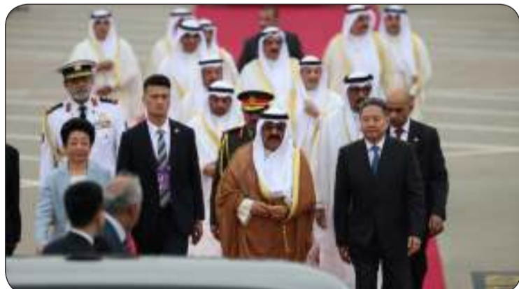
جانب من مراسم استقبال سموه

السلام عليكم ورحمة الله وبركاته،، يسرني في البداية أن أرحب بكم وأنقل لكم تحيات قائدنا ووالدنا حضرة صاحب السمو أمير البلاد المفدى الشيخ نواف الأحمد الجابر الصباح "حفظه الله وورعاه" ودعوات سموه بأن تكمل جهودكم