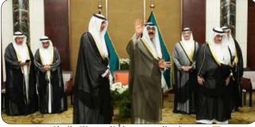
سمو ولي العهد محييا أبنائه وبناته الرياضيين

وتتوافق هذه المبادرة مع رؤية الكويت بالتحول إلى مركز مالي وتجاري عالمي في عام 2035 ورؤية إنشاء مدينة الحرير التي أطلقت عام 2006 مما يجسد اتفاقا جديدا وطموحا واسعا لإحياء طريق الحرير التاريخي.