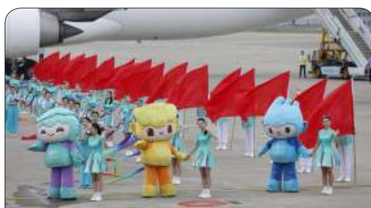
استقبال سمو ولي العهد