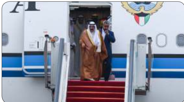
جانب من وصول سمو ولي العهد