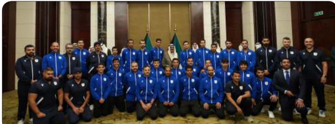
سمو ولي العهد خلال لقائه رئيس وأعضاء اللجنة الأولمبية وأبنائه الرياضيين

وتعد الكويت سابع أكبر وخلال السنوات الأخيرة