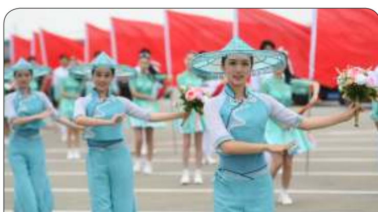
جانب من الاحتفال بوصول سموه