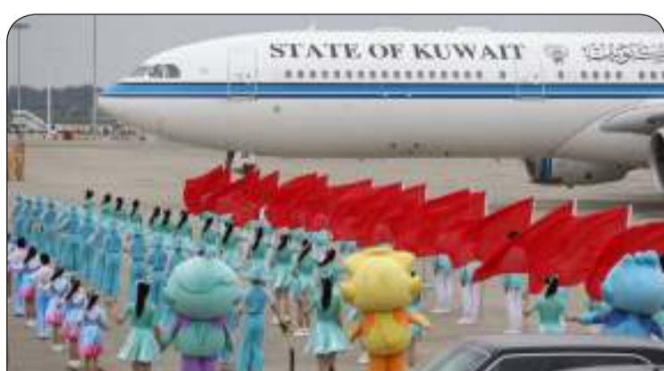
حفاوة الترحيب بالضيف الكبير