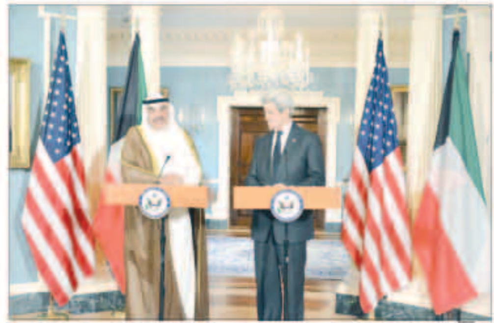
الخالد في المؤتمر الصحافي مع كيري

الخالد: تعزيز العلاقات الثنائية على مختلف الأصعدة ورسم خارطة طريق للعلاقات الاستراتيجية بين البلدين