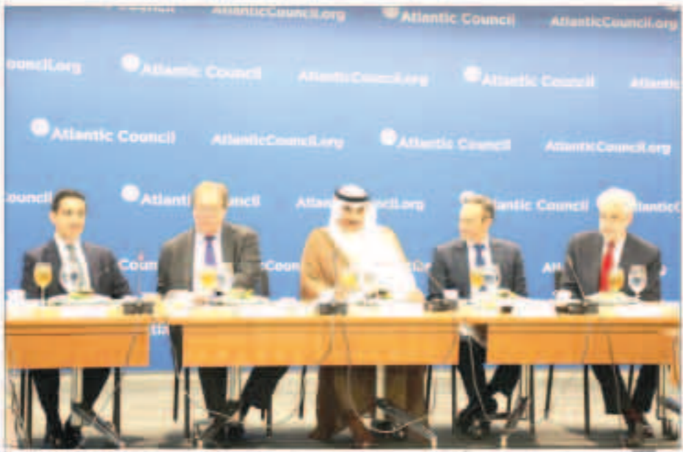
ويجلس محاضرة في المعهد الأطلسي بواشنطن

نستذكر التضحيات الجليلة التي قدمها المحاربون في تحرير الكويت حين اختلطت الدماء الكويتية بالأمريكية