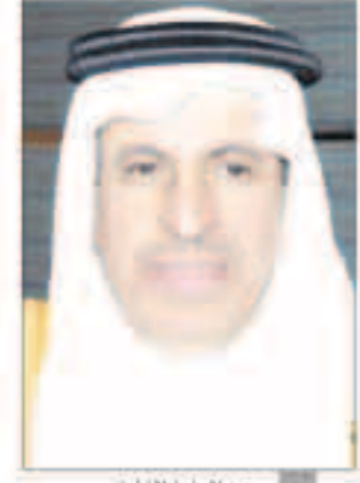
عبد العزيز الفايز

تضمن سفير خادم الحرمين الشريفين لسدي الكويت د.عبد العزيز بن إبراهيم الفايز الأمر السامي الذي أصدره خادم الحرمين الشريفين الملك سلمان بن عبدالعزيز آل سعود الليلة قبل الماضية بإعتماد تطبيق أحكام نظام المرور ولائحته التنفيذية بما فيها إصدار رخص القيادة للذكور والإناث على حد سواء. وأضاف السفير د.الفايز في تصريح صحفي أمس إن خادم الحرمين الشريفين يحفظه الله يتوخى دوماً مصلحة الوطن والمواطنين وأن هذا الأمر الكريم يمثل قراراً تاريخياً من قائدنا التاريخي يؤكد حرصه يحفظه الله على مواكبة التطورات والتحديات التي يعيشها المجتمع السعودي بما يتوافق مع الضوابط الشرعية