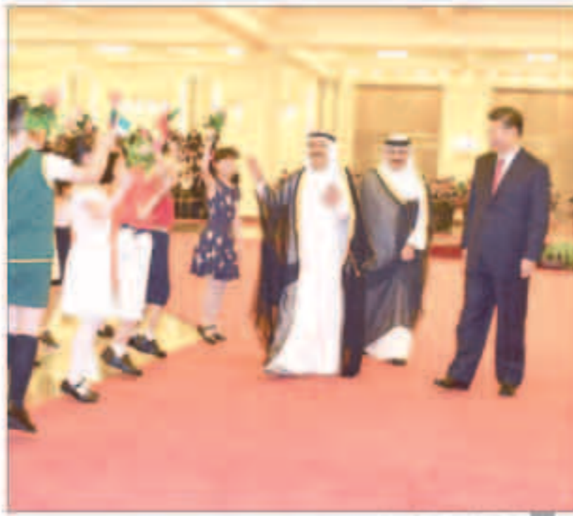
استقبال حافل لصاحب السمو