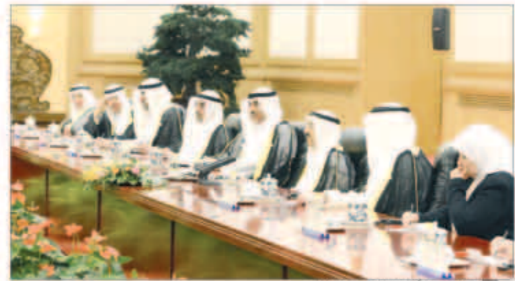
الأمير مترسلا الجانب الكويتي في المحادثات

بكين - «كويت»: أقيمت عصر امس في قصر الشعب بالعاصمة الصينية بكين مراسم الاستقبال الرسمية لسمو أمير البلاد الشيخ صباح الاحمد وذلك بمناسبة زيارة الدولة لجمهورية الصين الشعبية الصديقة.