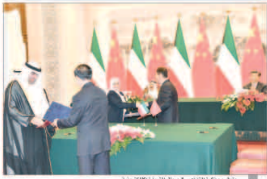
وتوقيع مذكرة التفاهم في مجال التجارة الإلكترونية