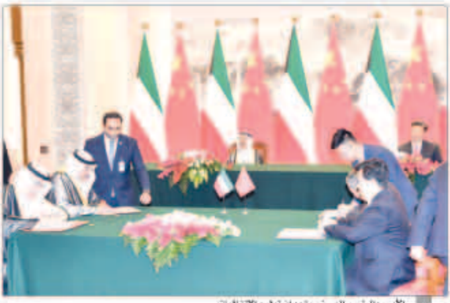
الأمير والرئيس الصيني يشهدان توقيع الاتفاقيات