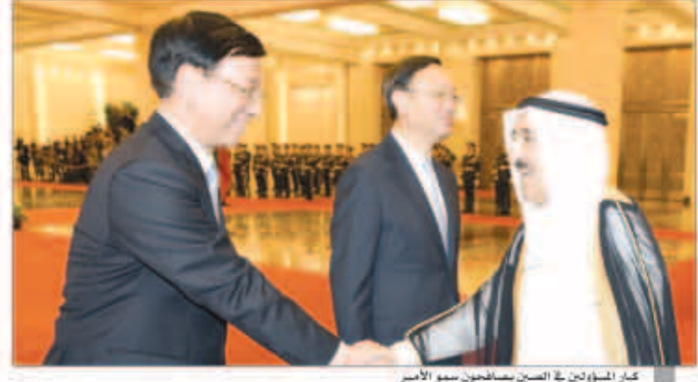
كبار المسؤولين في الصين يصادفون سمو الأمير