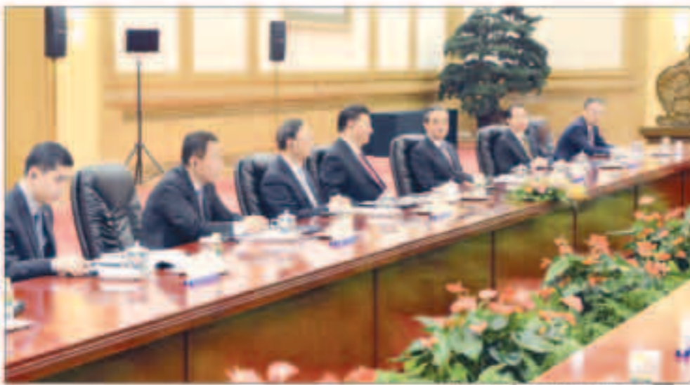
الرئيس يبعث مترسلا الجانب الصيني

الطرفان آلية للتعاون في إطار اللجنة المشتركة بين الصين والكويت المعنية بالتعاون الاقتصادي والتجاري. وتؤكد الاتفاقية على تعاون الطرفين من أجل تهيئة ظروف مواتية لتنمية التجارة الإلكترونية على أساس المنافع المتبادلة في مجالات تشمل الدراسات المشتركة وتبادل الخبرات في صنع السياسات والإدارة الحكومية في التجارة الإلكترونية والحوارات بين القطاعين العام والخاص. كما تتضمن تشجيع التعاون مع الشركات في التجارة الإلكترونية في الصين والكويت بما في ذلك عن طريق تشجيع تجارة المنتجات المميزة ذات الجودة العالية من بلدانهم من خلال التجارة الإلكترونية.