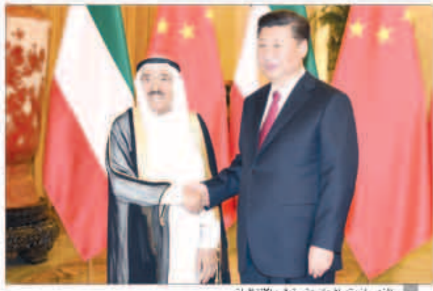
الزعيمان يتصافحان عقب توقيع الاتفاقيات