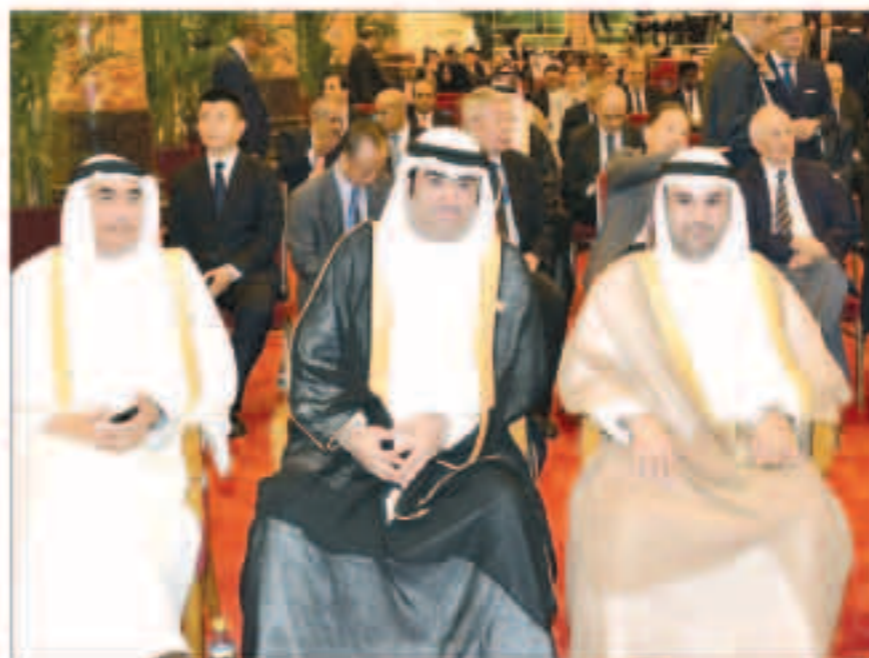
الوفد المرافق لصاحب السمو في المنتدى