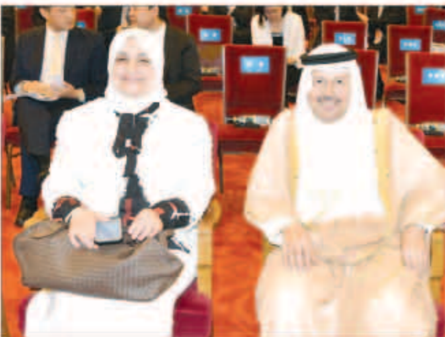
الوزيرة الصيغ ومدير مكتب صاحب السمو

على تحقيق التقدم والنتائج التي ننشدها ونتطلع بامل وتفاؤل إلى إجتماع الدورة الثامنة لمنتدى التعاون العربي الصيني. متوجهين بكل الشكر والتقدير لكل القائمين على الإعداد لهذا الإجتماع بجمهورية الصين الشعبية والدول العربية مع تمنياتنا لإجتماعنا بالتوفيق والنجاح.. والسلام عليكم ورحمة الله وبركاته. وكان صاحب السمو غادر الوفد الرسمي المرافق لسموه ظهر أمس جمهورية الصين الشعبية وزيارة الدولة وترؤس سموه وفد الكويت في الجلسة الافتتاحية للاجتماع الوزاري الثامن لمنتدى التعاون الصيني العربي. هذا وكان في وداع سموه على أرض المطار مساعد وزير الخارجية لغرب آسيا وشمال إفريقيا تشن شيواو دوغ وسفير جمهورية الصين الشعبية لدى دولة الكويت وانغ دي والمستشار بإدارة الرسم بوزارة الخارجية ها رولونغ وسفير دولة الكويت لدى جمهورية الصين الشعبية سمع جوهر حياث واعضاء السفارة. وافقت سموه السلامة في الحل والترحال. وكان سمو أمير البلاد الشيخ صباح الأحمد والرئيس الصيني شي جين بينغ قد شهدا في وقت سابق يوم أمس الأول مراسم التوقيع على سبع اتفاقيات ومذكرات تفاهم ثنائية بين البلدين الصديقين في مختلف المجالات. وكان صاحب السمو قد وصل إلى العاصمة الصينية بكين السبت الماضي في زيارة دولة رسمية هي الثانية له منذ توليد مقاليد الحكم بعد