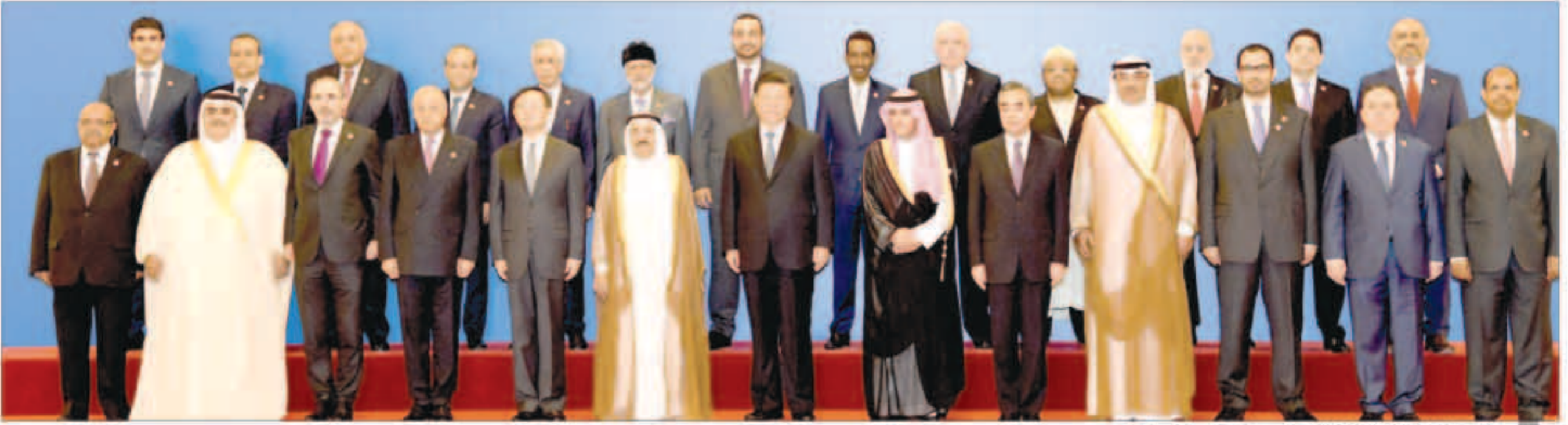
لجنة جامعة لرؤساء الوفود المشاركة في المنتدى بينهم صاحب السمو والرئيس الصيني