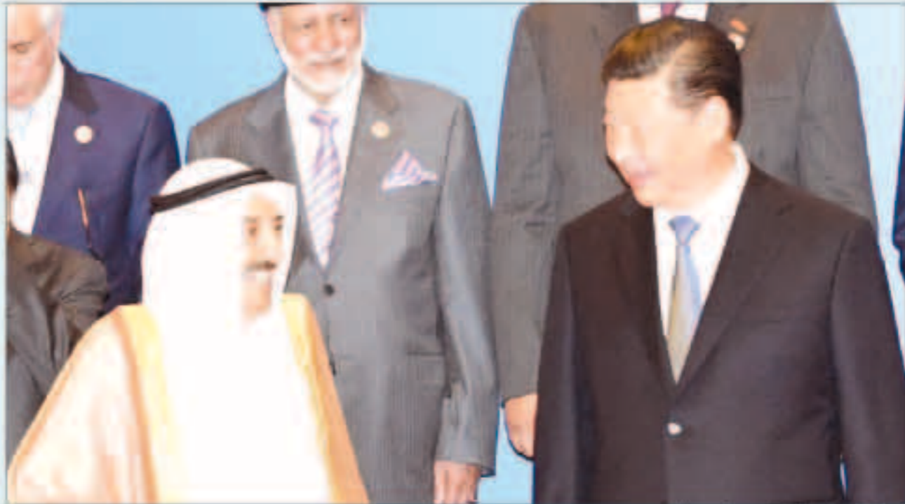
الرئيس الصيني مرحباً بسمو الأمير

الإعلامي ومشروع المكتبة الرقمية الصينية العربية التي جانب الإعلان عن انطلاق الدورة الرابعة لبرنامج الفنون العربية التي ستقام في الصين خلال الفترة المقبلة. على صعيد متصل اشاد وزيران أمس بنتائج زيارة الدولة الرسمية التي يقوم به سمو أمير البلاد الشيخ صباح الأحمد إلى الصين حالياً مؤكداً انها «ناجحة للشؤون الاجتماعية والعمل ووزيرة الدولة للشؤون الاقتصادية منذ الصباح في دولة الكويت إن دولة الكويت وجمهورية الصين الشعبية تتميزان بعلاقات عريقة