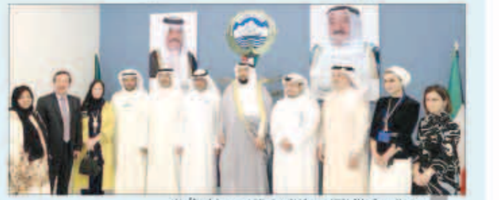
وزير الصحة خلال افتتاحه مركز الجهراء التخصصي لطب الأسنان

أعلن وزير الصحة الشيخ الدكتور ياسر الصباح عزم الوزارة إنشاء مركزي العاصمة والأحمدي التخصصيين لطب الأسنان خلال المرحلة المقبلة لتغطية جميع محافظات البلاد بما يتفق مع أهداف وغايات الخطة الإنمائية للدولة وبرنامج عمل الحكومة.