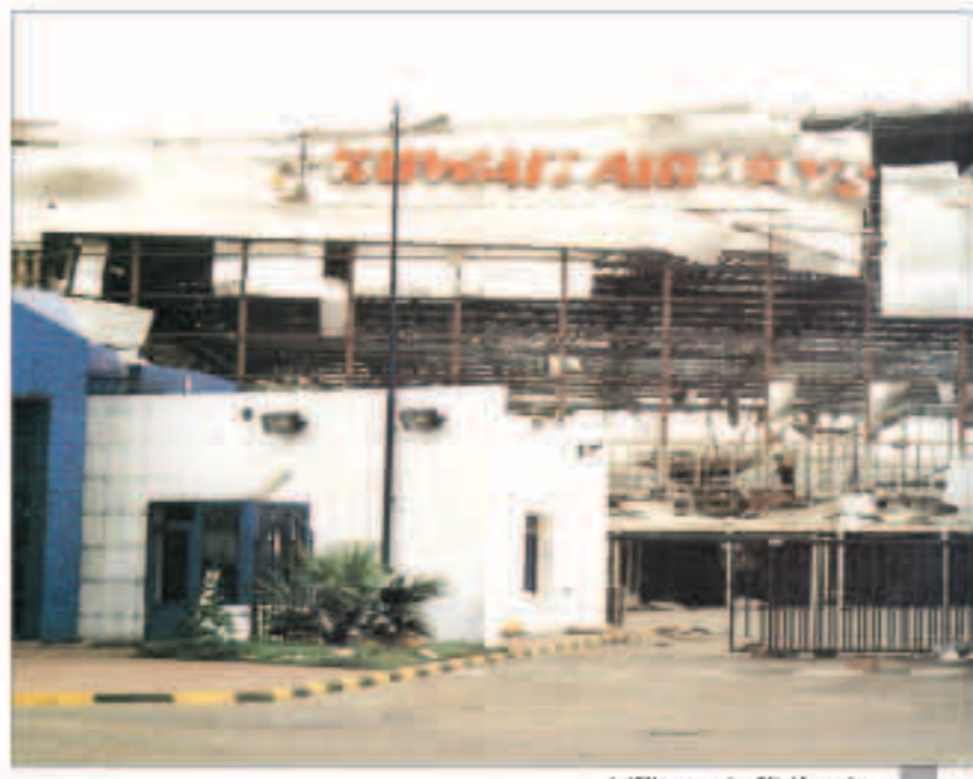
مبنى معمار الكويت دمنير بالكامل