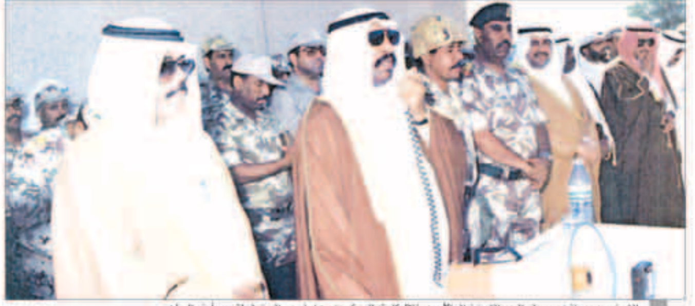
الشيخ سعد وبجانبه سمو ولي العهد الشيخ نواف الأحمد خلال كلمته للمعسكريين من أجل رص الصفوف لتحرير أرض الوطن