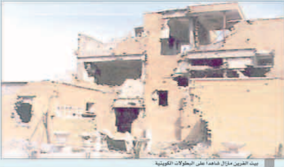
بيت الغرين مازال شاهداً على البطولات الكويتية

سنظل كويتيين نستذكر بكل إجلال وإكبار وقفة اشقائنا الخليجيين التاريخية مع الحق الكويتي