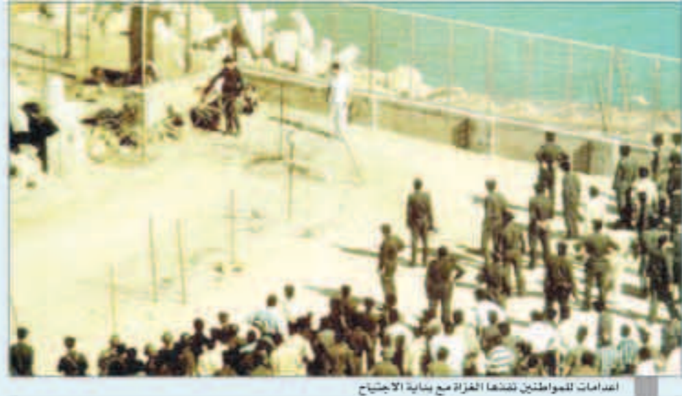
انضمامات للمواطنين لتتبعها الغزاة مع بداية الاجتياح

المناسبة مواتية لاستذكار شهداء الكويت الأبرار الذين ضحوا بحياتهم في سبيل الوطن