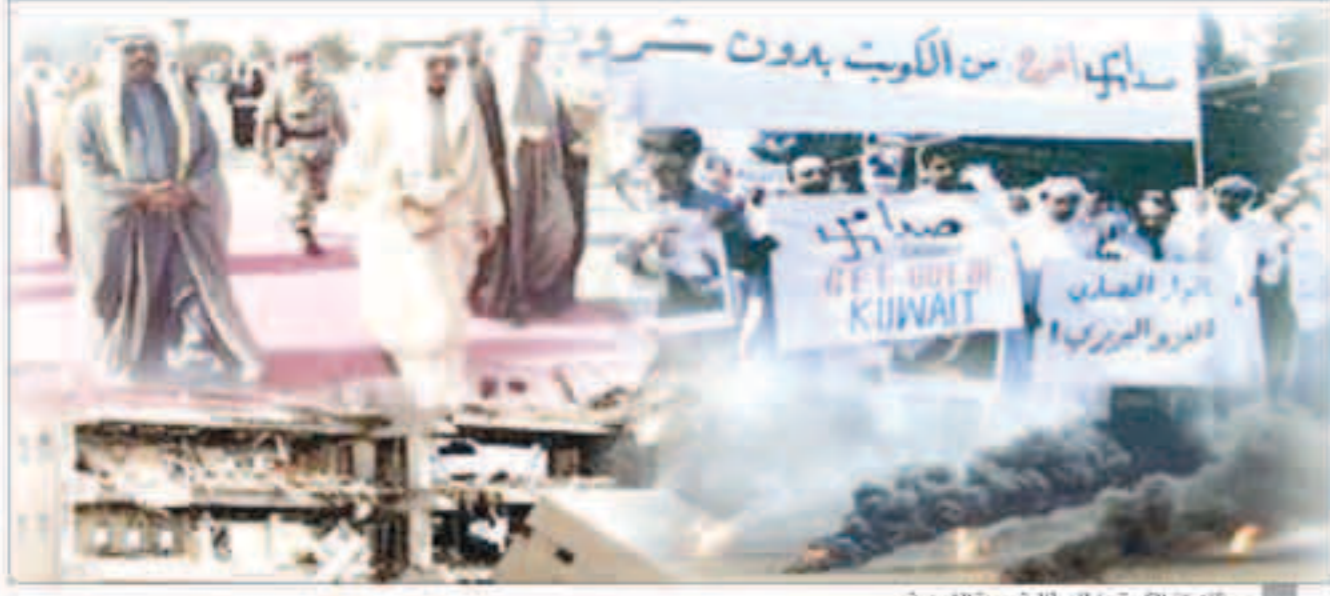
مظاهرات الكويتيين للمطالبة بعودة الشرعية

Friday 2 August 2019 - No.3434 - 12 th Year