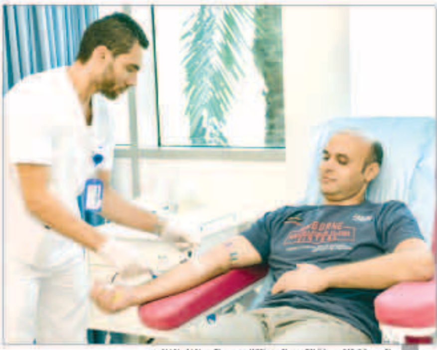
الصحة تطلق حملة التبرع بالدم بالتزامن مع ذكرى الغزو الفاش

2014 بتبرع سخى للمفوضية السامية لشؤون اللاجئين في الأمم المتحدة يقدر بثلاثة ملايين دولار لعملياتها الإنسانية بالعراق كما أمدت الكويت عام 2015 مبلغاً قدره 200 مليون دولار لإغاثة النازحين هناك أيضاً. ووزعت الكويت مئة مئة في جميعياتها الخيرية قبل حلول شهر رمضان 2016 أكثر من 12 الف سلة غذائية على الأسر النازحة في إقليم كردستان في حين شهد العام الماضي توزيع نحو 40 ألف سلة غذائية من قبل الهلال الأحمر الكويتي على العائلات النازحة في مدن الإقليم. وفي يوليو 2016 تعهدت الكويت بتقديم مساعدات إنسانية للعراق بقيمة 176 مليون دولار وذلك خلال مؤتمر المنحني لدعم العراق الذي عقد برعاية الكويت ودول أخرى في واشنطن ما دفع مجلس الأمن إلى الإشادة بما تقدمه الكويت من دعم مستمر لتحقيق الاستقرار في العراق. وعقب إعلان الحكومة العراقية تحرير مدينة الموصل مما يسنى بتنظيم الدولة الإسلامية «داعش» في يوليو 2017 استضافت الكويت في شهر فبراير الماضي مؤتمراً دولياً لإعادة إعمار المناطق المحررة في العراق مناشداً مع مبادئها في دعم الأشقاء وترجمة حقيقية لتسميتها من قبل منظمة الأمم المتحدة «مركزاً للعمل الإنساني».