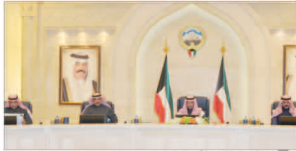
سمو الشيخ جابر المبارك مترئسا اجتماع مجلس الوزراء

له للجمهورية التونسية الشقيقة مملا عن حضرة صاحب السمو الأمير لحضور احتفال توقيع الدستور التونسي. كما أحاط سموه المجلس بفحوى