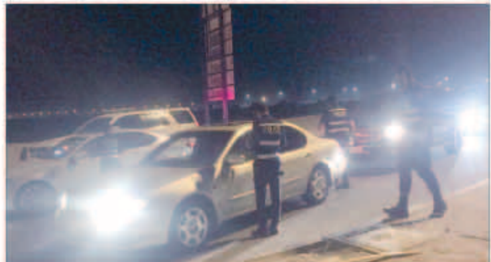
التفتيش في الكويت

ما تناقلته مواقع التواصل الاجتماعي عار عن الصحة ولايمتد للواقع بصلته الأجهزة الأمنية المعنية قامت بزيارة للمسجد بعد التنسيق مع المشرف عليه