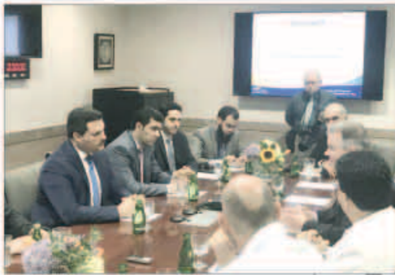
.. وبعثت مع إدارة المستشفى لبحث تبادل الخبرات