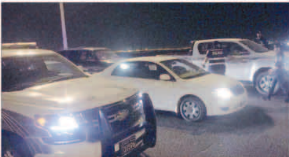
إجراءات أمنية روتينية لاحقة المطورين

جميع دور العبادة والمرافق الحيوية تطبق عليها مثل هذه التدابير الأمنية الإجراءات الأمنية تغطي محافظات الكويت وليست مقصورة على مناطق محددة