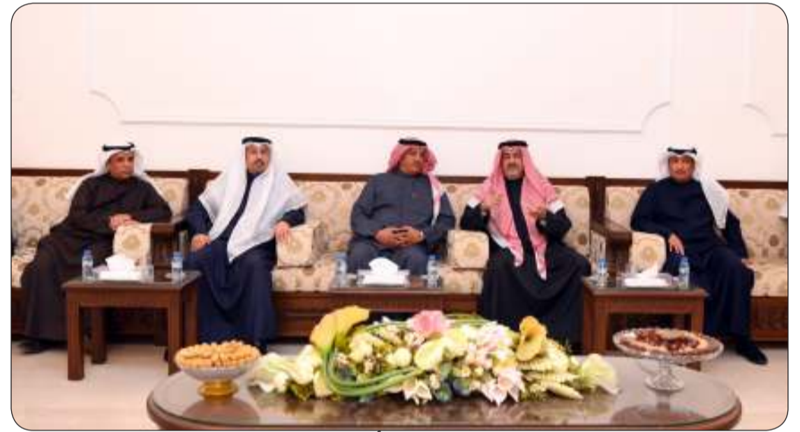
محافظ العاصمة يؤكد أهمية زيارة الدواوين