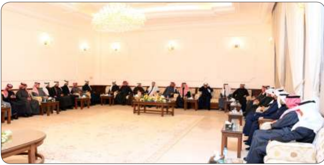
جانب من رواد الديوانية