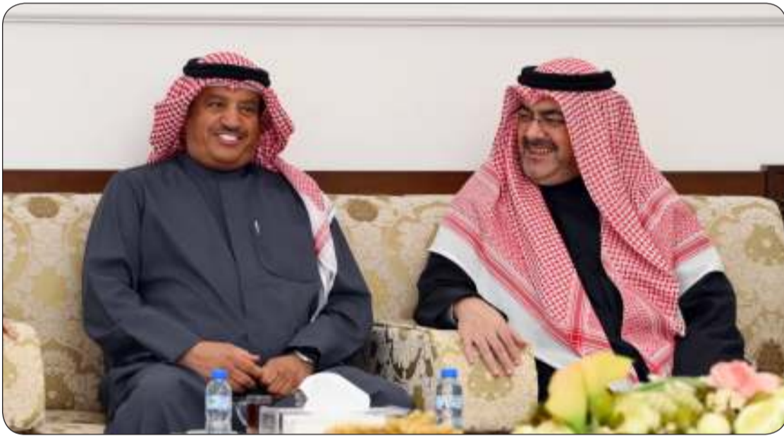
حديث ودي بين المحافظ والدكتور بركات الهديبان

انطلاقا من أهمية الديوانية في المجتمع الكويتي، والتي تمثل مجلسا دائما للحوار والتشاور وطرح الأفكار، وتبادل الرؤى بحرية وبعبء عن الأجواء الرسمية، وتلمسا لمطالب المواطنين، والاستماع لشكاواهم ومقترحاتهم، قام محافظ العاصمة الشيخ عبدالله العلي