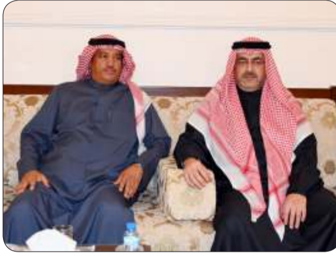
اللقاء تناول العديد من القضايا المهمة التي تخص المحافظة