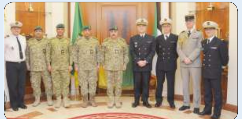
وكيل الحرس الوطني مستقبلا وفدا عسكريا من وزارة الدفاع الفرنسية

للوفد الفرنسي تحيات قيادة الحرس الوطني ممثلة برئيس الحرس الوطني الشيخ مبارك الحمود ونائب رئيس الحرس الوطني الشيخ فيصل النواف. وأشار إلى أهمية تعزيز التعاون المشترك مع الجانب الفرنسي في عدة مجالات في ضوء العلاقات الممتازة التي تربط دولة الكويت وجمهورية فرنسا الصديقة.