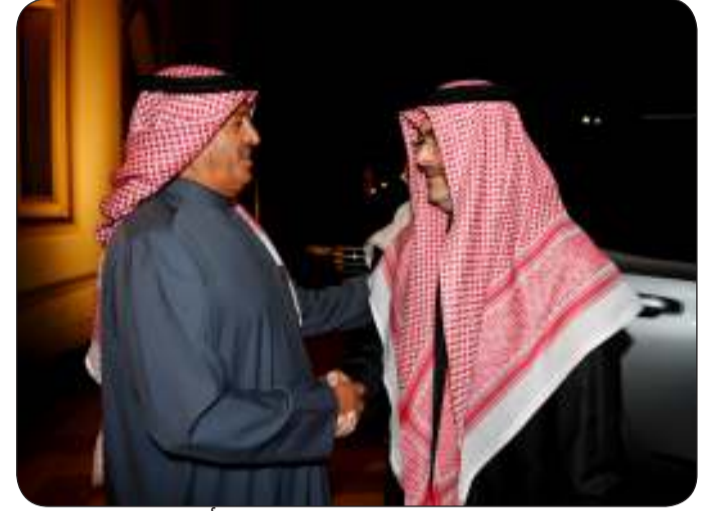
محافظ العاصمة لدى وصوله وفي استقباله أ.د. بركات الهديبان

السوعي الثقافي والديني. وساهمت الديوانيات بدور اجتماعي وثقافي وإعلامي في الكويت وقد اتخذ من بعضها مقرات للأنشطة الثقافية والأدبية ودورا للكتب ومنها ما كان نواة لتأسيس مقر لأول الأندية الرياضية في الكويت وهو "النادي الأهلي" في عام 1952 وكذلك مقرات طبييا للعلاج.