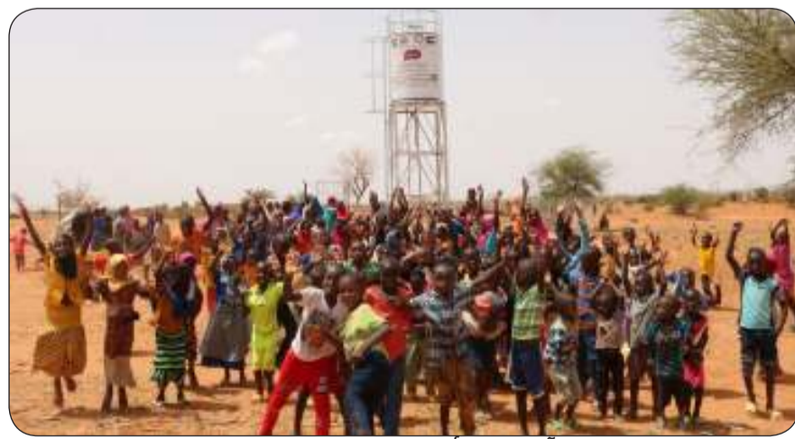
آبار تخيل أسعدت 2 مليون إنسان