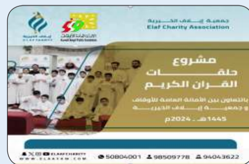
إيلاف تنفذ حلقات القرآن