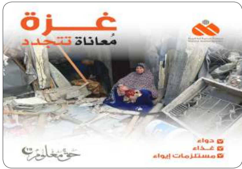
حملة الرحمة لدعم غزة

الدائم تجاه غزة وأهلها، وهي امتداد لسلسلة من المشاريع الإغاثية والتنموية التي قدمتها الجمعية على مدار أزمة غزة. وأشار الحداد إلى أن الجمعية تستند في عملها إلى شبكة ميدانية من الشركاء المحليين الموثوقين، لضمان وصول المساعدات إلى مستحقيها بسرعة وكفاءة، مؤكداً أن الحملة ما زالت مفتوحة أمام المتبرعين الذين يرغبون في مد يد العون لإخوانهم في غزة. واختتم الحداد تصريحه بدعوة أهل الخير إلى المسارعة في دعم هذه الحملة، مؤكداً أن كل تبرع، مهما كان حجمه، هو شعاع أمل لأهلنا في غزة وتخفيف لعنائاتهم وتفريج لكربتهم.