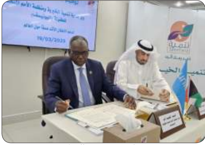
جانب من توقيع المذكرة