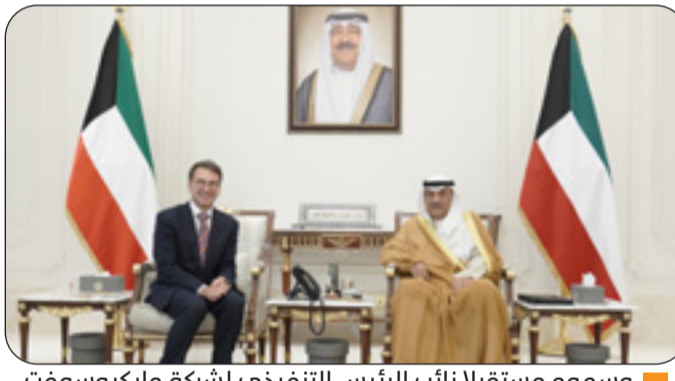
وسموه مستقبلا نائب الرئيس التنفيذي لشركة مايكروسوفت

سموه التقى نائب الرئيس التنفيذي والمدير التجاري لشركة "مايكروسوفت" ولي العهد استقبل مسؤولين أميين بمناسبة زيارتهما للبلاد