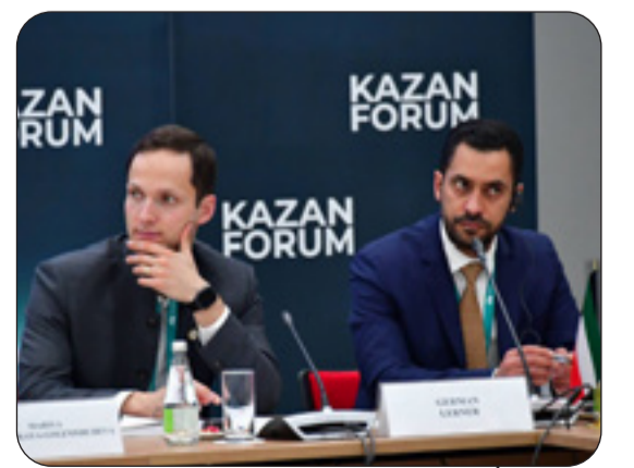
القائم بأعمال السفارة الكويتية بالإنابة في موسكو أحمد البعيجان

موسكو - "كونا": قال القائم بأعمال السفارة الكويتية بالإنابة لدى روسيا المستشار أحمد البعيجان إن الرؤية الاستراتيجية لدولة الكويت في علاقاتها مع روسيا الاتحادية تركز على تعزيز أواصر التعاون في المجالات المختلفة لا سيما في الطاقة المتجددة والتكنولوجيا الحديثة. جاء ذلك في تصريح أدلى به المستشار البعيجان لـ"كونا" بمناسبة اختتام المنتدى الاقتصادي