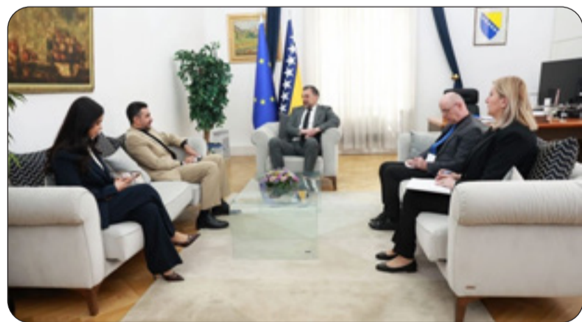
سفيرنا البناي مع وزير الخارجية البوسني

شتمت المجالات. وأضاف البيان ان الجانبين اتفقا على ضرورة تنسيق المواقف والتعاون المشترك في المحافل الدولية واستمرار التشاور حول مختلف القضايا الإقليمية والدولية لا سيما ذات الاهتمام المشترك. من جانبه أعرب كوناكوفيتش عن الترحيب بالمواطنين الكويتيين الذين يزورون البلاد سنويا مؤكدا على توفير كل سبل الراحة وتذليل أي عقبات قد تواجه الزوار.