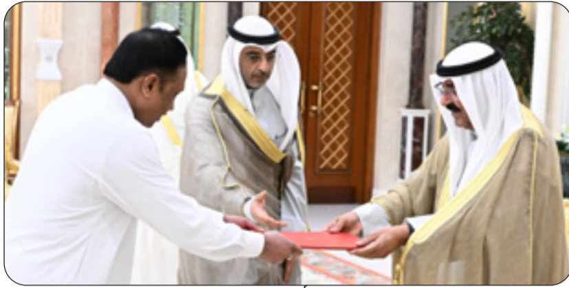
صاحب السمو يتسلم أوراق اعتماد سفير السلفادور

جمهورية الأوروغواي الشرقية الصديقة عبر فيها سموه عن خالص تعازيه وصادق مواساته بوفاة رئيس جمهورية الأوروغواي الشرقية الأسبق خوسيه موخिका كوردانو راجيا سموه لأسرته ولذويه جميل الصبر. وبعث سموه في العهد الشيخ صباح الخالد، وسمو الشيخ أحمد عبدالله رئيس مجلس الوزراء ببرقيتي تعزية مماثلتين.