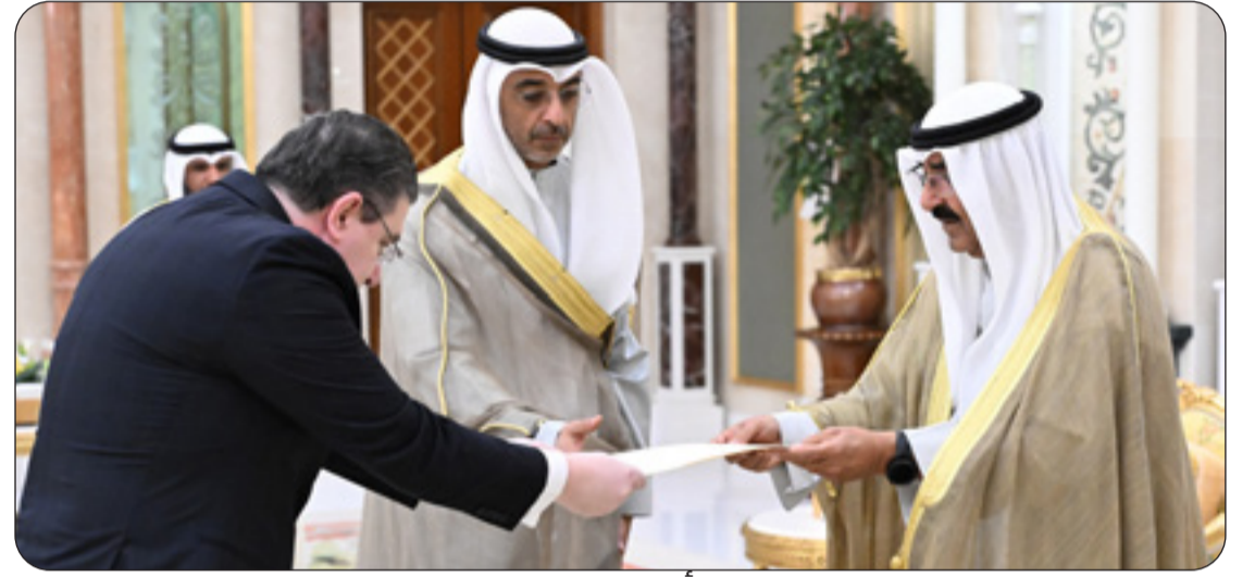
وسموه يتسلم أوراق اعتماد السفير القبرصي

بحضور ممثلي الجهات الحكومية لتحسين سمعة البلاد رئيس الوزراء بالإنابة ترأس اجتماعا للجنة تنظيم العمل الخيري