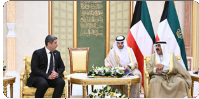
سمو أمير البلاد مستقبلا سفير أرمينيا

احتفل في قصر بيان صباح أمس بتسليم سمو أمير البلاد الشيخ مشعل الأحمد أوراق اعتماد كل من السفير د. ظفر اقبال سفيرا لجمهورية باكستان الإسلامية والسفير اندرياس بانايوتو سفيرا لجمهورية قبرص والسفير خوان كارلوس ستابن بويلات سفيرا لجمهورية السلفادور والسفير ارسين الكسندر اراكليان سفيرا لجمهورية