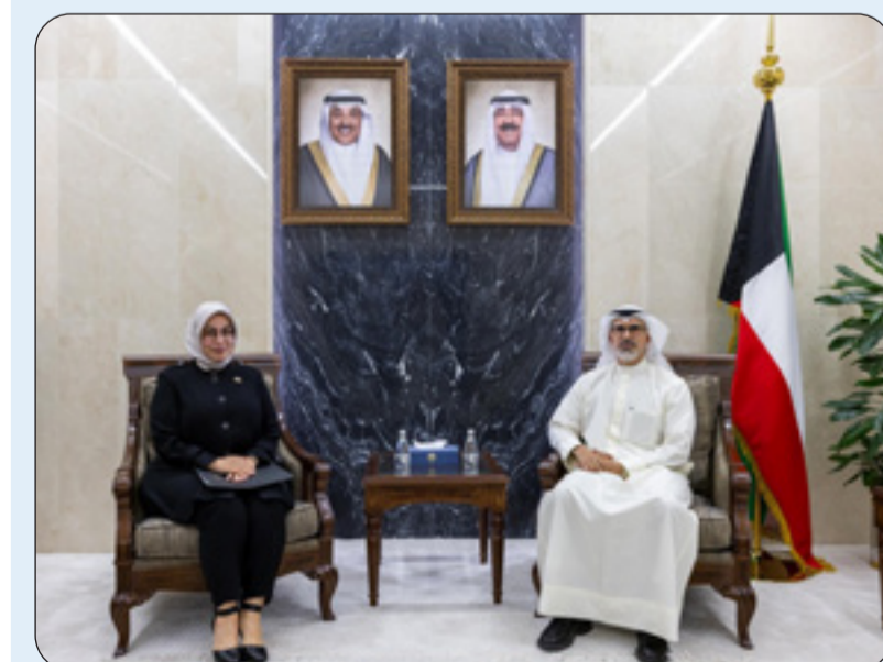
الشيخ جراح الجابر مستقبلا طوبى نور سونمز

نائب وزير الخارجية بحث مع السفيرة التركية القضايا الإقليمية والدولية