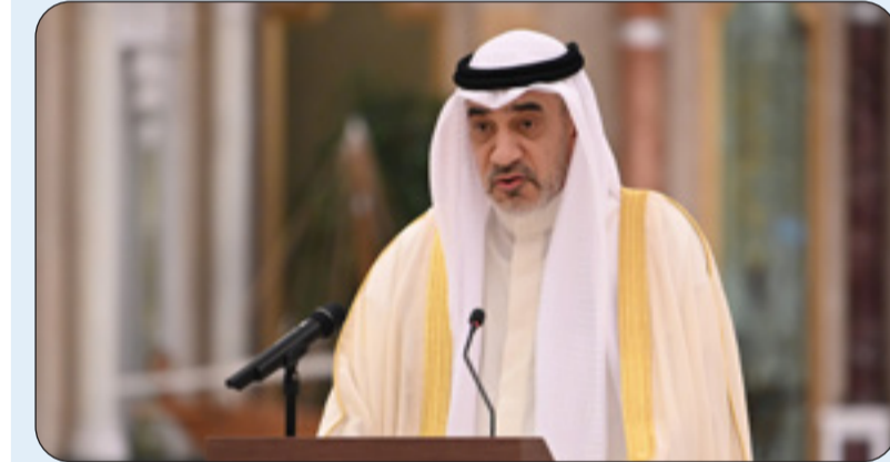
الشيخ فهد اليوسف

بحضور ممثلي الجهات الحكومية لتحسين سمعة البلاد رئيس الوزراء بالإنابة ترأس اجتماعا للجنة تنظيم العمل الخيري