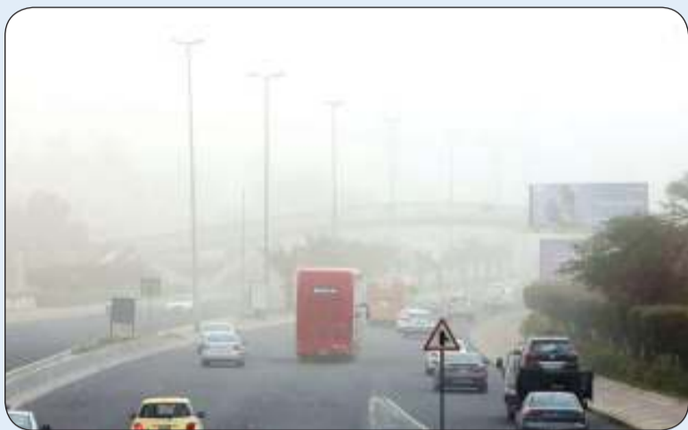
«الأرصاد» تحذر من موجة غبار تبدأ اليوم

للافراد والمؤسسات. وقال الانصاري ان ادارة الارصاد الجوية الكويتية تأسست قبل الاستقلال عام 1953 ومعها أنشئت اول محطة مناخية مأمولة في يوليو من العام نفسه في منطقة الشويخ لثقتها محطة العمرية بعد عام واحد تم محطة مطار الكويت عام 1957.