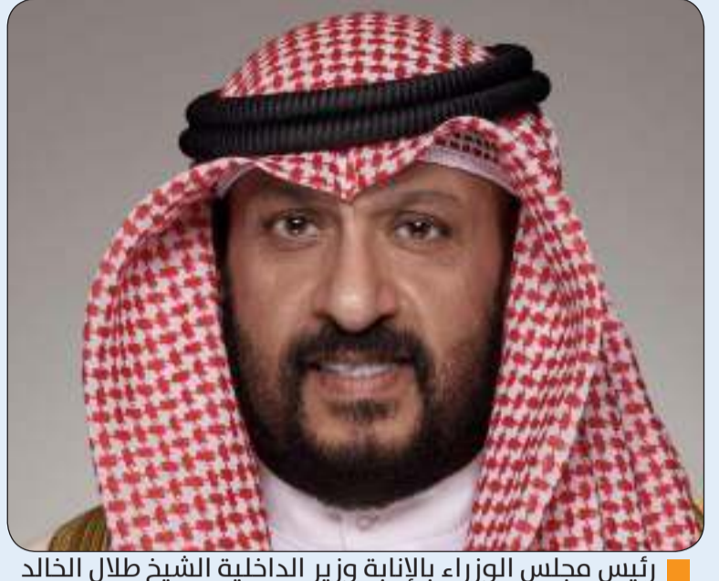
■ رئيس مجلس الوزراء بالإنابة وزير الداخلية الشيخ طلال الخالد

وجه رئيس مجلس الوزراء بالإنابة وزير الداخلية الشيخ طلال الخالد أمس الخميس بالعمل على اتخاذ الإجراءات اللازمة بمنح 8686 عسكرياً وسامياً الدفاع الوطني و1690 عسكرياً وسامياً الواجب العسكري من مختلف الدرجات وفق اللوائح والنظم المعمول بها في هذا الأمر.