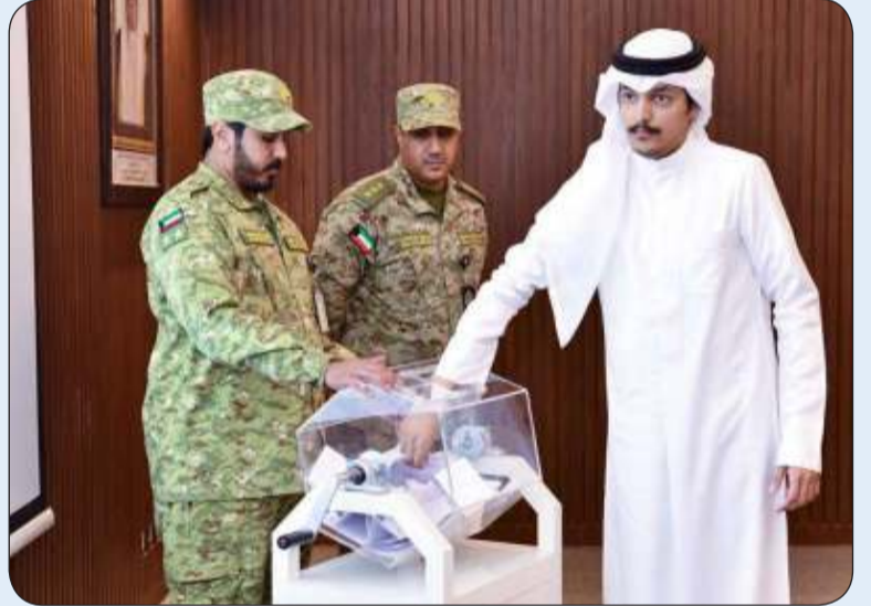
■ جانب من إجراء القرعة

وأكد وكيل الحرس الوطني حرص الحرس على ترسيخ مبدأ الشفافية والعدالة بين المتقدمين من خلال قرعة علنية لنيل شرف الالتحاق بالخدمة العسكرية، مشدداً على أن إجراءات القبول في الحرس الوطني تراعى مبدأ تكافؤ الفرص بين الشباب الكويتي وتنتهج الشفافية والمصداقية في جميع المراحل، متمنياً لمن حالفهم الحظ في القرعة التوفيق والنجاح في مسيرتهم الدراسية والوظيفية.