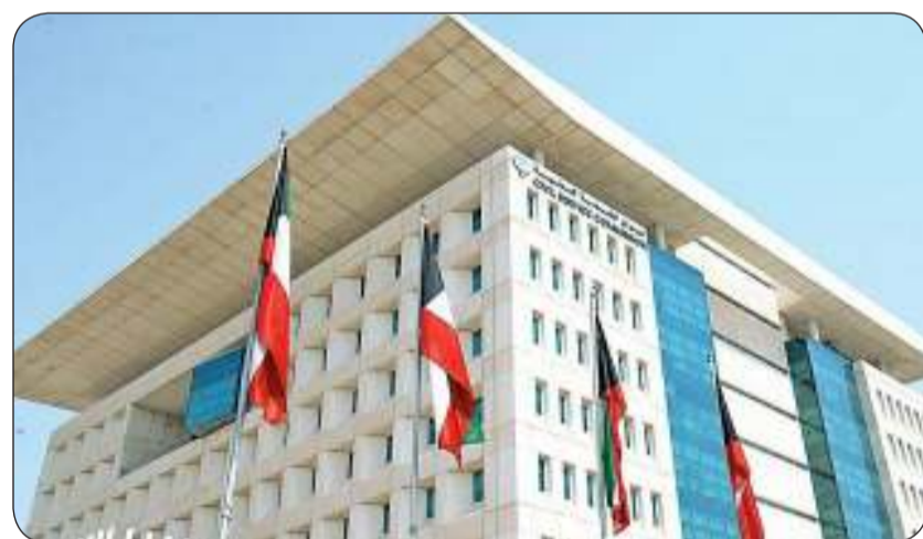
■ ديوان الخدمة المدنية

أحكام هذه المادة على الموظف المشمول بتخفيف ساعات العمل لأي سبب من الأسباب المقررة قانوناً كما لا تطبق على الخاضعين لنظام التغيب الجزئي بدون أجر وتحدد مواعيد حضورهم وانصرافهم وفقاً لجهات عملهم الحكومية. وأفاد بأنه يجوز للجهة الحكومية إلزام الموظفين بميعاد عمل واحد محدد حضوراً وانصرافاً أو إلزامهم بالاختيار بين أكثر من ميعاد عمل ليختار الموظف ميعاداً واحداً محدد حضوراً وانصرافاً ويجوز للجهة تحديد هذه المواعيد.