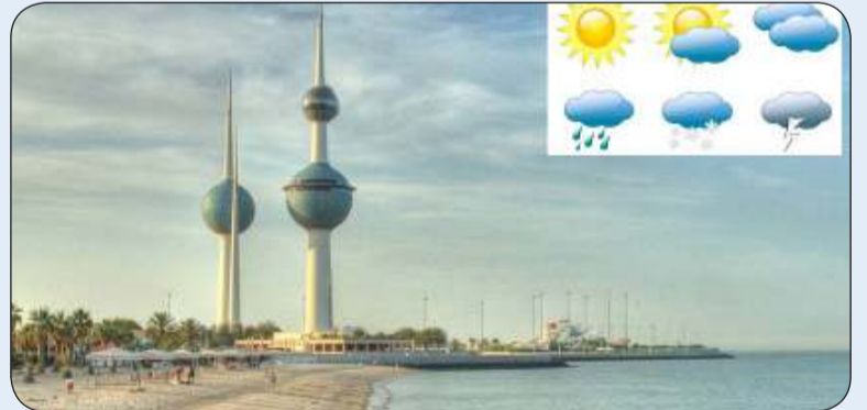
■ طقس عطلة نهاية الأسبوع حار نهاراً معتدل ليلاً

توقعت إدارة الأرصاد الجوية أن يكون طقس البلاد في عطلة نهاية الأسبوع حاراً نهاراً ومائلاً للحرارة أول الليل ومعتدل الحرارة آخراً.