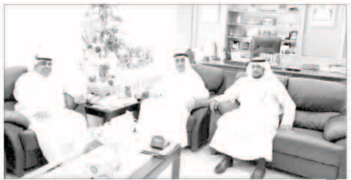
جانب من لقاء اعضاء الحقوقيين مع مدير الجامعة

بحثت جمعية الحقوقيين الكويتية مع مدير جامعة الكويت تعيين حملة شهادات الدكتوراه اعضاء هيئة تدريس، وابتعثت الحاصلين علي الماجستير للخارج للحصول علي شهادات عليا. وقالت الجمعية في بيان اصدرته انها عقدت إجتماعا مطولا مع مدير الجامعة، حيث طرح عليه اعضاء مجلس الإدارة جملة من الاقتراحات والمطالبات المتعلقة بحملة الشهادات العليا من الحقوقيين الكويتيين. وأضافت الجمعية ان اعضاء مجلس الإدارة طرخوا إمكانية تعيين الحاصلين علي شهادات دكتوراه اعضاء هيئة تدريس في الجامعة، وكذلك ابتعث حملة الماجستير من خريجي جامعة الكويت والجامعات الأخرى المعترف بها لدراسة الدكتوراه في الخارج. وأشارت الي ان سعادة مدير الجامعة تفهم مطالبات الجمعية وابدى استعدادا لدراسة تلك المقترحات والرد عليها خلال فترة قصيرة. وأكدت الجمعية حرصها علي تبني قضايا اعضائها وايصال مطالباتهم للمسؤولين في الجهات الحكومية المختلفة من أجل ايجاد الحلول والمقترحات المناسبة لها.