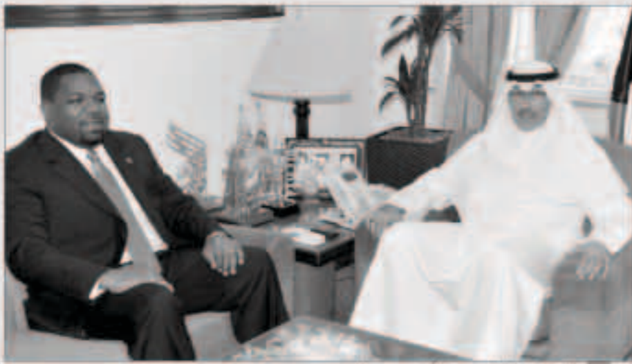
الشيخ فوزي الخالد مستقبلا سفير سوازيلاند

استقبل محافظ الأحمد الشيخ فوزي الخالد في مكتبه بديوان عام المحافظة، سفير مملكة سوازيلاند لدى الكويت سوتجا دلاميني، حيث جرى تبادل الأحاديث الودية التي تناولت العلاقات الثنائية التي تربط البلدين الصديقين وسبل تعزيزها في جميع المجالات. وتطرق اللقاء الي بحث آفاق تطوير التعاون المشترك وتبادل الخبرات بين البلدين علي مستوى الأنظمة الإدارية المحلية عموما وعلى صعيد المحافظات والمناطق علي وجه الخصوص. وأعرب الخالد خلال اللقاء عن تقديره لسفير سوازيلاند علي زيارته متمنيا التوفيق والنجاح له خلال مسيرة عمله في البلاد من أجل الدفع بعلاقات الصداقة بين البلدين إلى آفاق أوسع وأرحب. من جهة أعرب السفير سوتجا دلاميني عن سعاده وامتنانه تحفاوة استقبال الخالد، ممتنا التقدير البالغ للرعاية التي تحظى بها البيعة الدبلوماسية وجانبه بلاده علي الصعيدين الرسمي والشعبي منذ مباشرته مهامه في دولة الكويت.