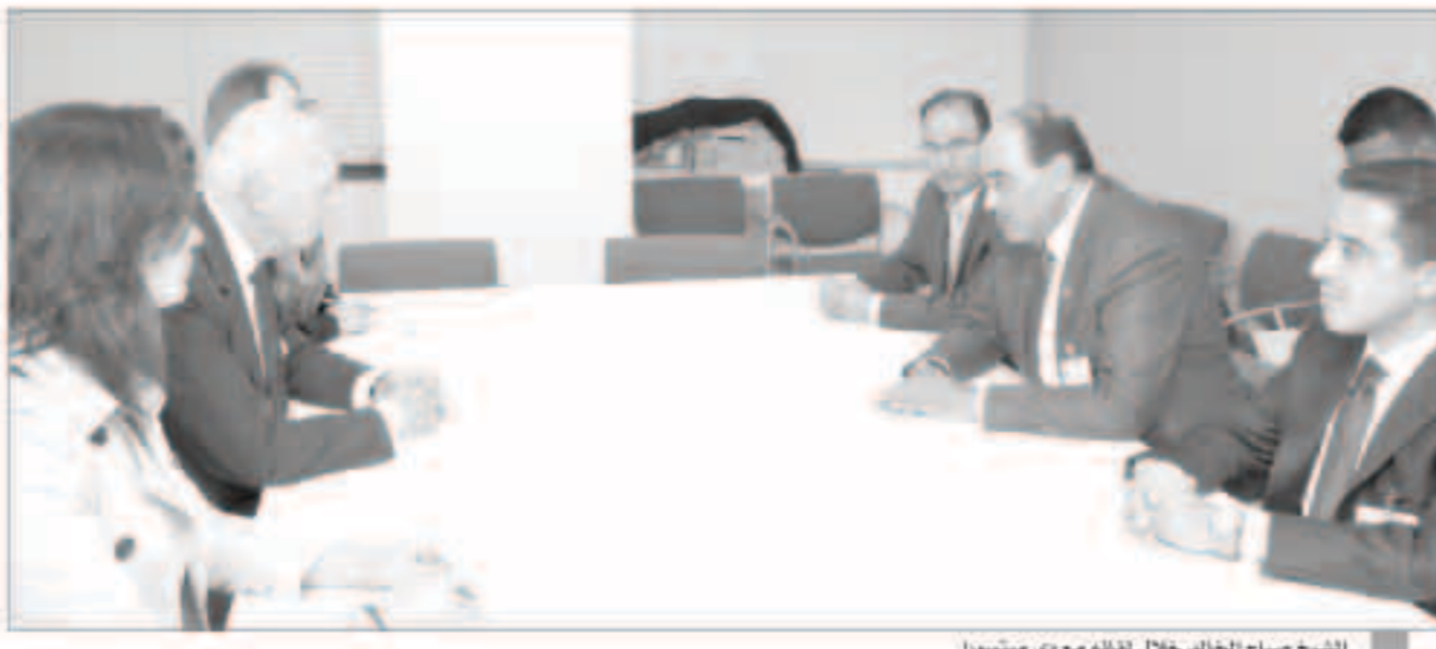
الشيخ صباح الخالد خلال لقائه مع دي ميستورا

وأضاف ان حكومة دولة الكويت شكلت فريقاً مخصصاً بمتابعة وتنفيذ والمبادرات التي اطلقتها سمو أمير البلاد وهي منح قروض ميسرة للدول الإفريقية بقيمة مليار دولار