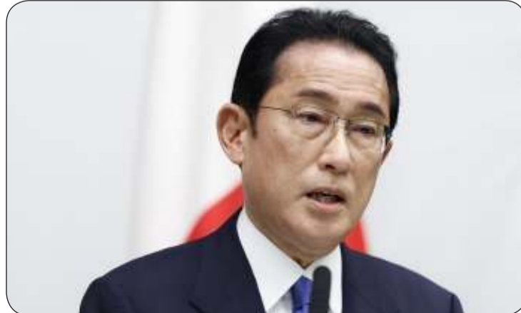
رئيس الوزراء الياباني