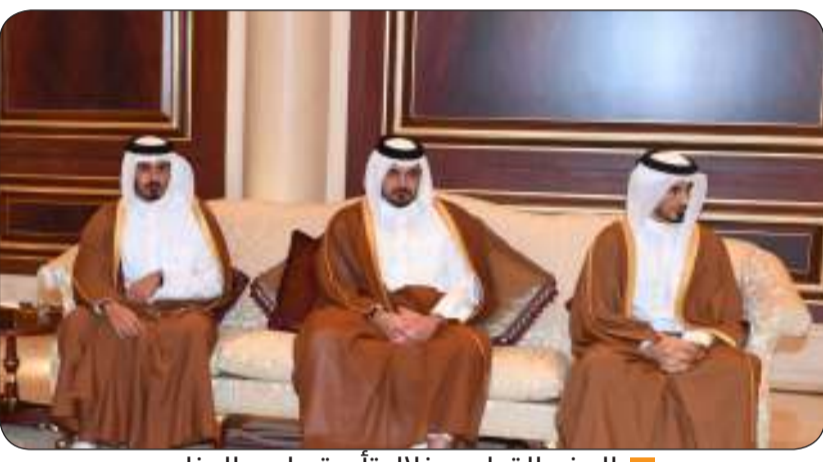
الوفد القطري خلال تأدية واجب العزاء

بدوره تعي رئيس جمهورية جيبوتي اسماعيل عمر جيله سمو أمير البلاد الراحل الشيخ نواف الأحمد الذي انتقل إلى جوار ربه يوم أمس الأول السبت. وأعرب جيله في بيان نشرته الرئاسة الجيبوتية تلقت "كونا" نسخة منه أمس الأحد عن تلقيه ببالغ الحزن والأسى خبر وفاة المغفور له بإذن الله تعالى سمو الأمير الراحل مشيرا إلى "التغيرات الإيجابية التي شهدتها البلاد تحت قيادته". وقال إن سموه كان قائدا ذات خبرة ومكانة تحظى بالاحترام خصوصا من خلال توقعه لما سيحدث وجاهزيته لها فضلا عن التزامه المستمر لضمان الاستقرار والتطور في الوطن العربي. ودعا المولى عز وجل أن يتغمد سمو الأمير الراحل بواسع رحمته ويسكنه فسح جناته ويلهم أسرة آل صباح والشعب الكويتي الصبر والسلوان.