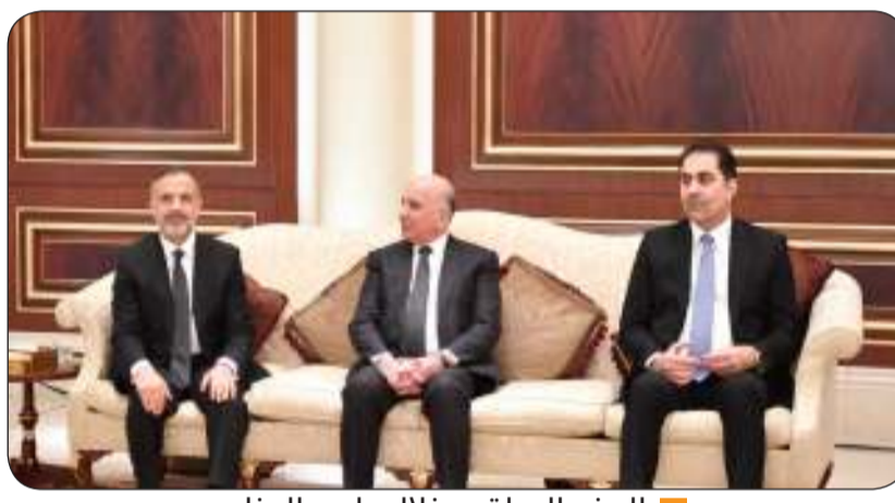
الوفد العراقي خلال واجب العزاء

بليكن : بالنيابة عن الولايات المتحدة أتقدم بخالص التعازي لأسرة آل الصباح ولجميع الكويتيين الاتحاد الأوروبي : سيتذكر الراحل كل من يعمل من أجل الاستقرار الإقليمي والتفاهم المتبادل بين الدول كيشيدا : لقد أدى سموه دورا مهما في بناء علاقات وثيقة مع الدول الأخرى وتحقيق السلام نار يندرا : شعرت بحزن عميق عندما علمت بنبا الوفاة المحزن لصاحب السمو الشيخ نواف الأحمد فنزويلا : لا شك أن هذا الرحيل سيكون خسارة كبيرة للمجتمع الدولي