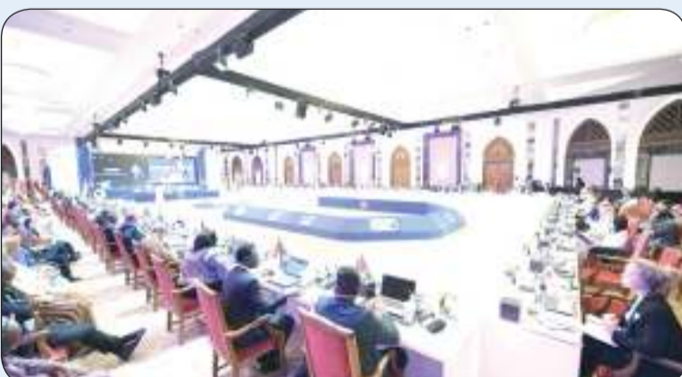
جانب من المؤتمر

وأعرب عن شكره وتقديره لسلطنة عمان ومنظمة «إيسيسكو» على هذا التنظيم الرائع للمؤتمر آملا أن يحقق