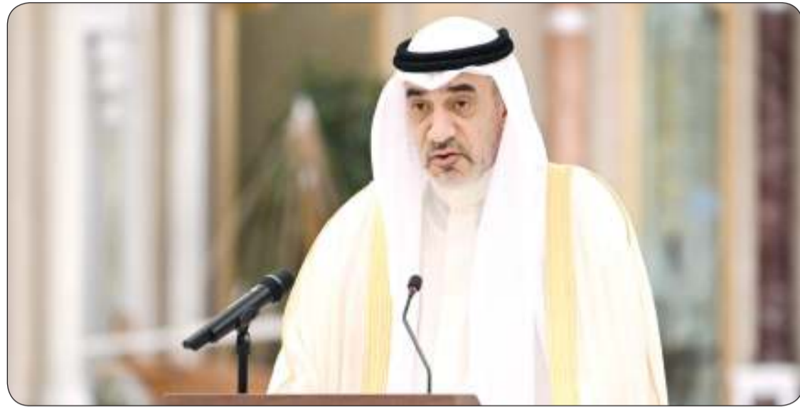
الشيخ فهد اليوسف

عقدت اللجنة العليا لتحقيق الجنسية اجتماعا أمس الخميس برئاسة النائب الأول لرئيس مجلس الوزراء ووزير الدفاع ووزير الداخلية الشيخ فهد اليوسف رئيس اللجنة العليا لتحقيق الجنسية الكويتية. وقالت وزارة الداخلية في بيان صحفي إن اللجنة قررت سحب وفقد وإسقاط الجنسية الكويتية من 133 حالة تمهيدا لعرضها على مجلس الوزراء.