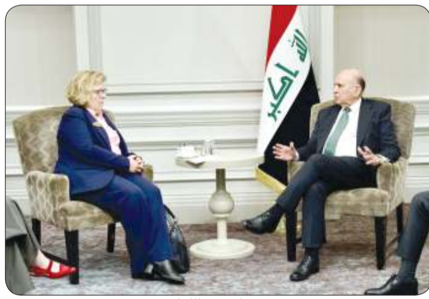
جانب من اللقاء

ووفق البيان ناقش الجانبان العراقي والأمريكي الأزمات الحالية في الشرق الأوسط وشددوا على ضرورة إيقاف إطلاق النار في المنطقة وحل الخلافات عبر الطرق الدبلوماسية وضرورة بذل الجهود لمساعدة النازحين اللبنانيين وتوفير الدعم لإنهاء الأزمة الإنسانية.