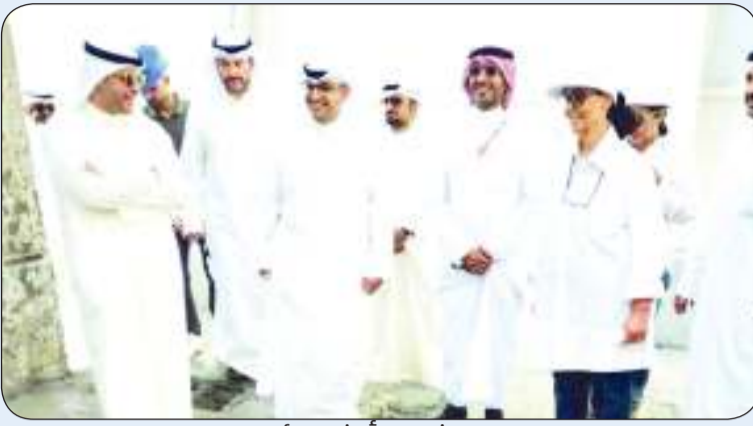
وزير البلدية والشيخة أمثال الأحمد خلال الجولة

قام وزير الدولة لشؤون البلدية ووزير الشؤون الإسكان عبداللطيف المشاري ورئيسة مركز العمل التطوعي الشيخة أمثال الأحمد بزيارة ميدانية لموقع مشروع «إعادة إعمار المباركية» والجزء المتضرر من الحريق، لوقوف على آخر تطورات تنفيذ المشروع وتذليل المعوقات للانتهاء منه خلال الوقت المحدد.