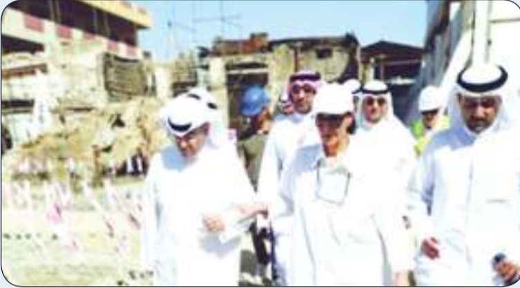
جانب من الجولة

قام وزير الدولة لشؤون البلدية ووزير الشؤون الإسكان عبداللطيف المشاري ورئيسة مركز العمل التطوعي الشيخة أمثال الأحمد بزيارة ميدانية لموقع مشروع «إعادة إعمار المباركية» والجزء المتضرر من الحريق، لوقوف على آخر تطورات تنفيذ المشروع وتذليل المعوقات للانتهاء منه خلال الوقت المحدد.