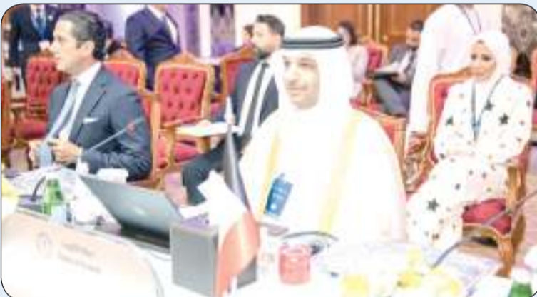
محمد الخالدي في مؤتمر وزراء التربية والتعليم بدول العالم الإسلامي (الإيسيسكو) في مسقط

مسقط - «كونا»: أكد وزير التعليم العالي والبحث العلمي ووزير التربية بالوكالة الدكتور ناصر الجلال أمس الخميس أهمية بحث التحديات والمخاطر التي تعيق الجهود الرامية إلى تحقيق أهداف التنمية وما تقوم به منظمة «إيسيسكو» من جهود مقدرة لضمان التعليم الجيد.