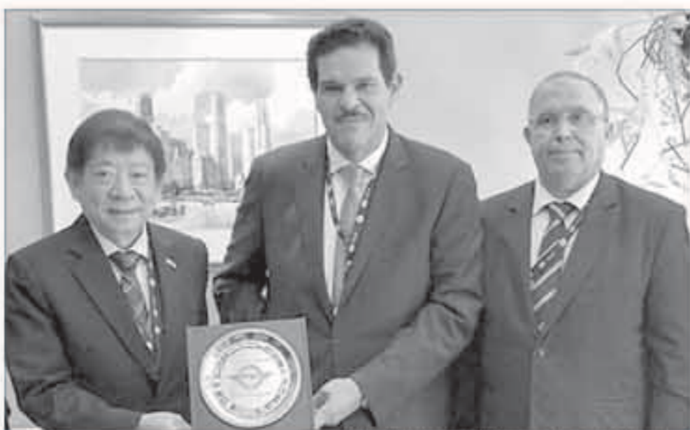
الشيخ سلمان الحمود، خلال لقائه وزير النقل السنغافوري

يخطئ به من سمو الشيخ جابر المبارك رئيس مجلس الوزراء وأكد الشيخ سلمان الحمود حرص الكويت على الاستمرار في التقدم والتطور وصولاً إلى تأسيس هيئة مستقلة للطيران المدني أسوة بالدول المتقدمة. وانتخب الشيخ سلمان الحمود نائباً أول لرئيس الجمعية العمومية لمنظمة الطيران المدني الدولي خلال افتتاح أعمال اجتماعاتها في مدينة مونتريال يوم أمس الأربعاء. من جانب آخر أجرى الشيخ سلمان الصباح على هامش اجتماعات الجمعية العمومية مباحثات مع وزير النقل السنغافوري كاو بون وان تركزت على سبل تعزيز التعاون المشترك في مجال النقل الجوي وتبادل الخبرات في مجالات الملاحة وسلامة الطيران والنقل الجوي وإدارة المطارات.