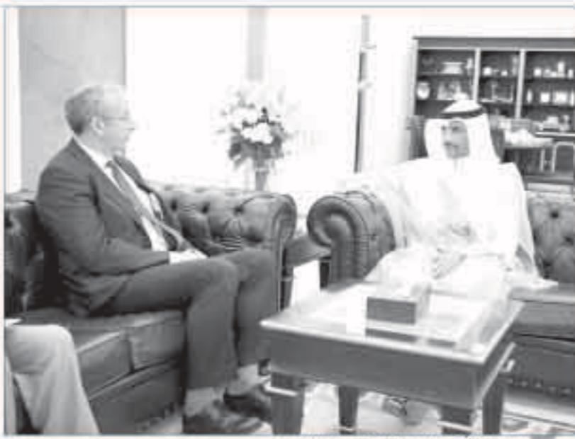
ومستقبلاً سفير المملكة المتحدة لدى البلاد