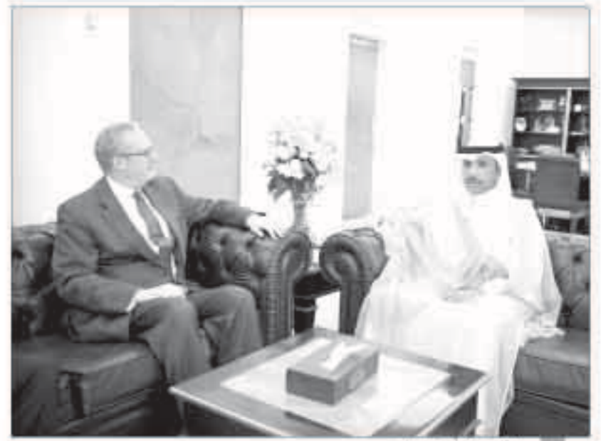
الغانم ملتقى سفير الإمارات