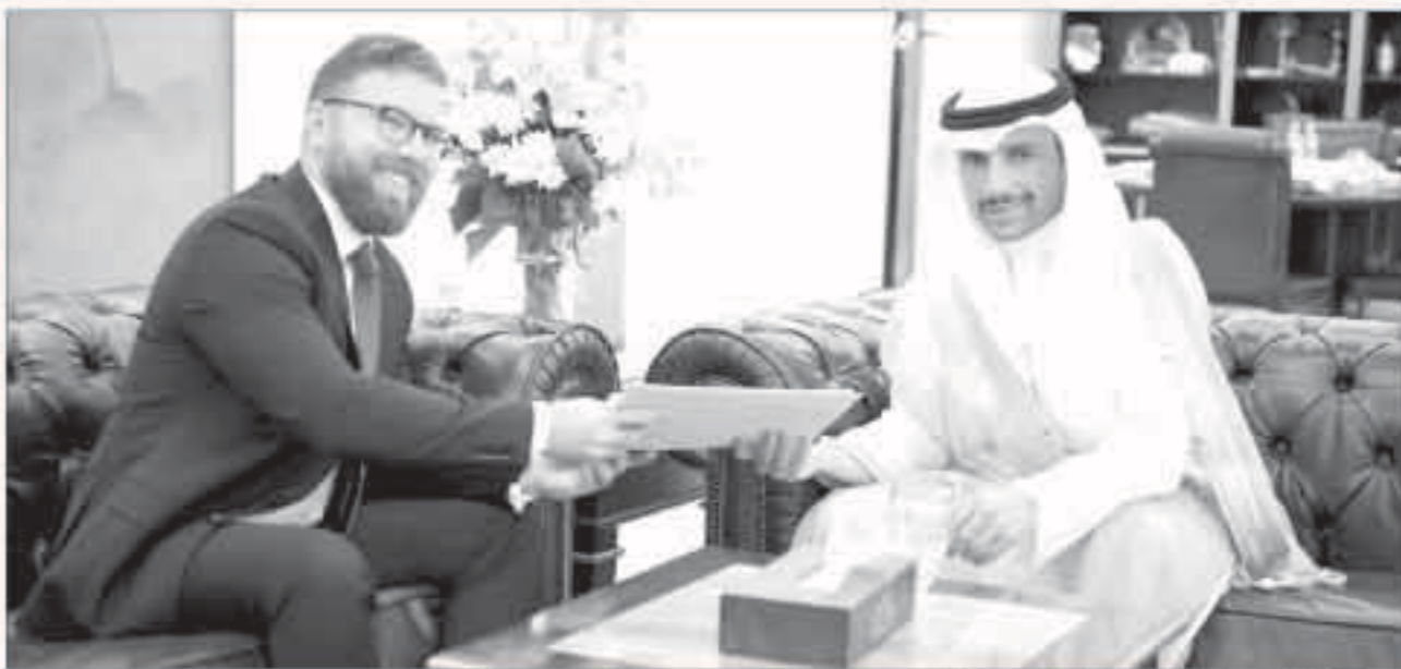
رئيس مجلس الأمة مستقبلاً السفير الهنغاري