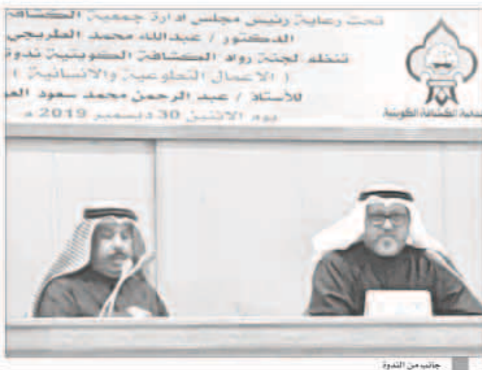
جانب من الندوة

المعلومات بين الفاطنين في المناطق المحلثة وأسرى الحرب وتوهم وتعزيز المعلومات والاتصالات مع الاتحاد الدولي لجمعيات الصليب والهلال الأحمر والجمعيات الوطنية.