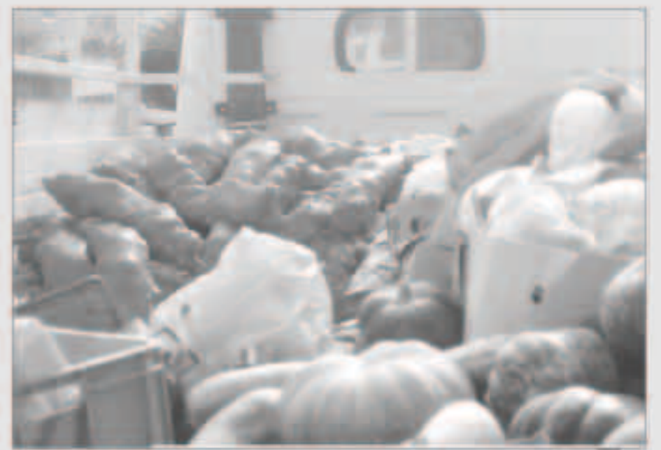
جانب من المخالفات

مخالفاتهم وإحالتهم للجهات المختصة لإبعادهم عن البلاد، مؤكداً أن الحملات مستمرة على مدار الساعة لرصد المخالفين واتخاذ كل الإجراءات القانونية بحقهم.