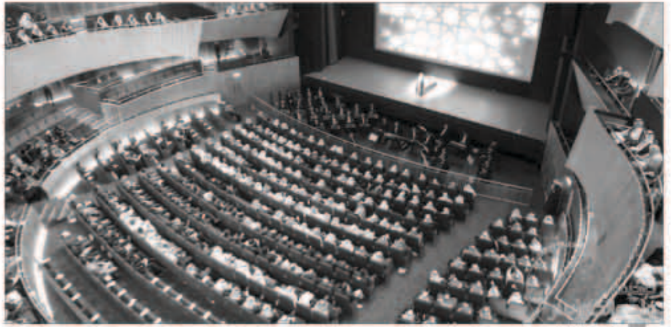
المسرح من الداخل