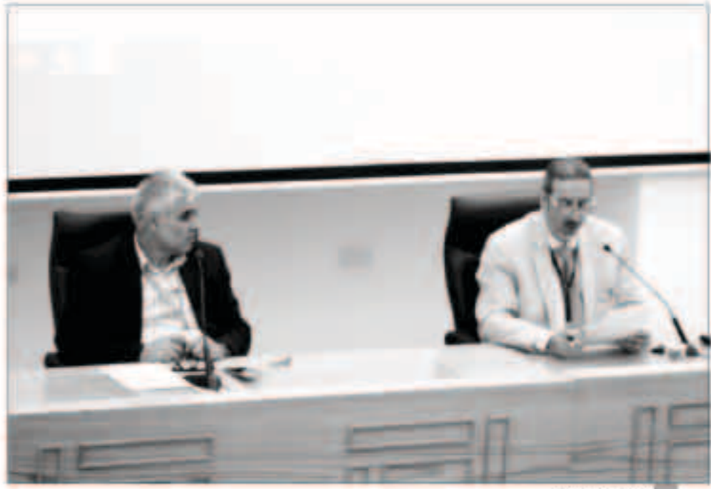
العلي يلقي كلمته

وأشار إلى أن المركز ينظم دورات للتأهيل والتدريب للشباب كما يوفر للباحثين والراغبين في الإطلاع على الفنون الإسلامية