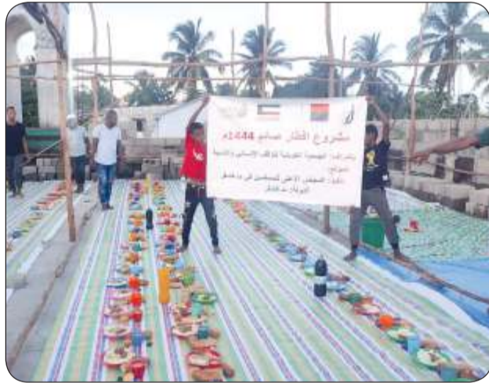
مشروع إفطار الصائم