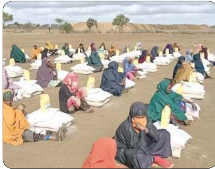
توزيع السلال الغذائية على المحتاجات

شهدت مساجد الوقف الإنساني في مدغشقر دخول 180 شخصاً في الإسلام عبر برامج الجمعية الدعوية والإرشادية، وتأتي تلك الإنجازات المتنوعة في إطار أهداف الجمعية المتعلقة بإقامة مشاريع تنموية وتعليمية وصحية ودعوية وإغاثية ووقفية داخل الكويت، وفي الدول الأخرى، مجدداً شكره لأهل الخير الذين ضربوا بتبرعاتهم أروع المثلى في البذل والعطاء، سائلاً المولى تبارك وتعالى أن يكتب أجورهم وأن يقبل منهم صالح الأعمال.