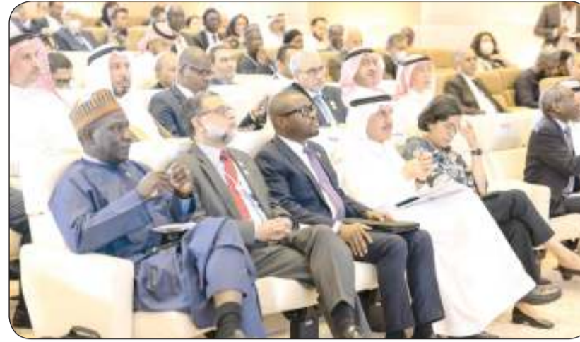
المتوق والمطوع لدى مشاركتهما في الاجتماعات السنوية للبنك الإسلامي

التعلم لدى اللاجئين السوريين بشراكة استراتيجية مع البنك الإسلامي للتنمية وصندوق التزامن الإسلامي وجمعية التميز الإنساني بتكلفة إجمالية تجاوزت مليوني دولار أمريكي بهدف خدمة 15 ألف طالب وطالبة و2000 معلم في لبنان والأردن والداخل السوري. وتعد الاجتماعات السنوية لمجموعة البنك الإسلامي للتنمية بمثابة منصة مهمة للقادة العالميين وصانعي السياسات والفاعلين في مشهد التنمية، وغيرهم من أصحاب المصلحة للاجتماع معاً ومناقشة قضايا التنمية الحرجة، حيث تشمل اجتماعات هذا العام أيضاً انعقاد منتدى القطاع الخاص، الذي تستضيفه كيانات مجموعة البنك الإسلامي للتنمية، التي