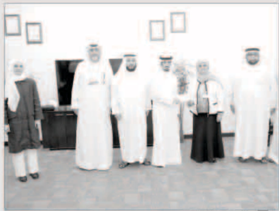
جانب من تسليم شيك التبرع

مشيرة إلى أن بيت الزكاة يوفر قسماً خاصاً لخدمة الشركات ويوفر محاسبين متخصصين لحساب زكاة الشركات كما يمكن للشركات التواصل مع البيت في حال رغبتهم بالاحتفاظ بخصوصية حساباتهم وبدوره يقوم البيت بإرشادهم حول كيفية حساب الزكاة الخاصة بهم.