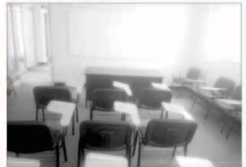
تجهيز القاعات الدراسية