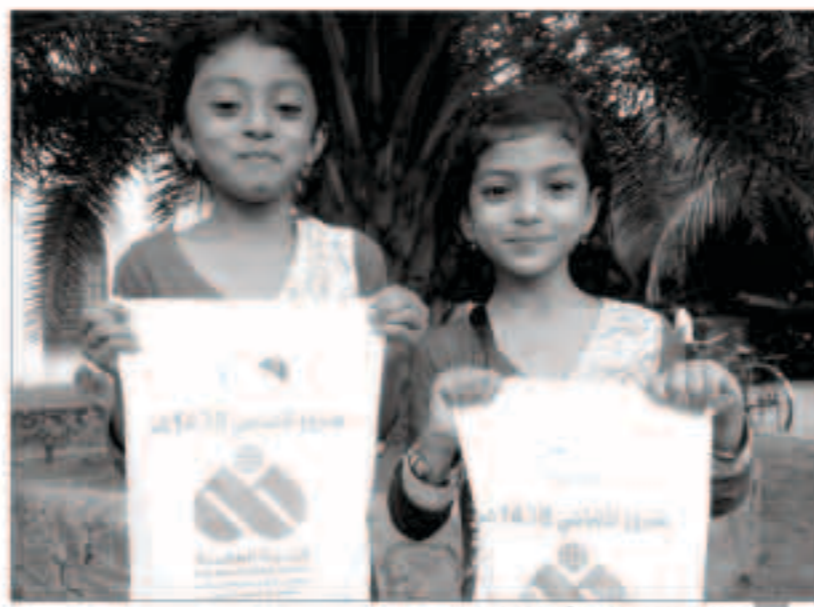
طفلتان صغيرتان مع أضاحي الكويت