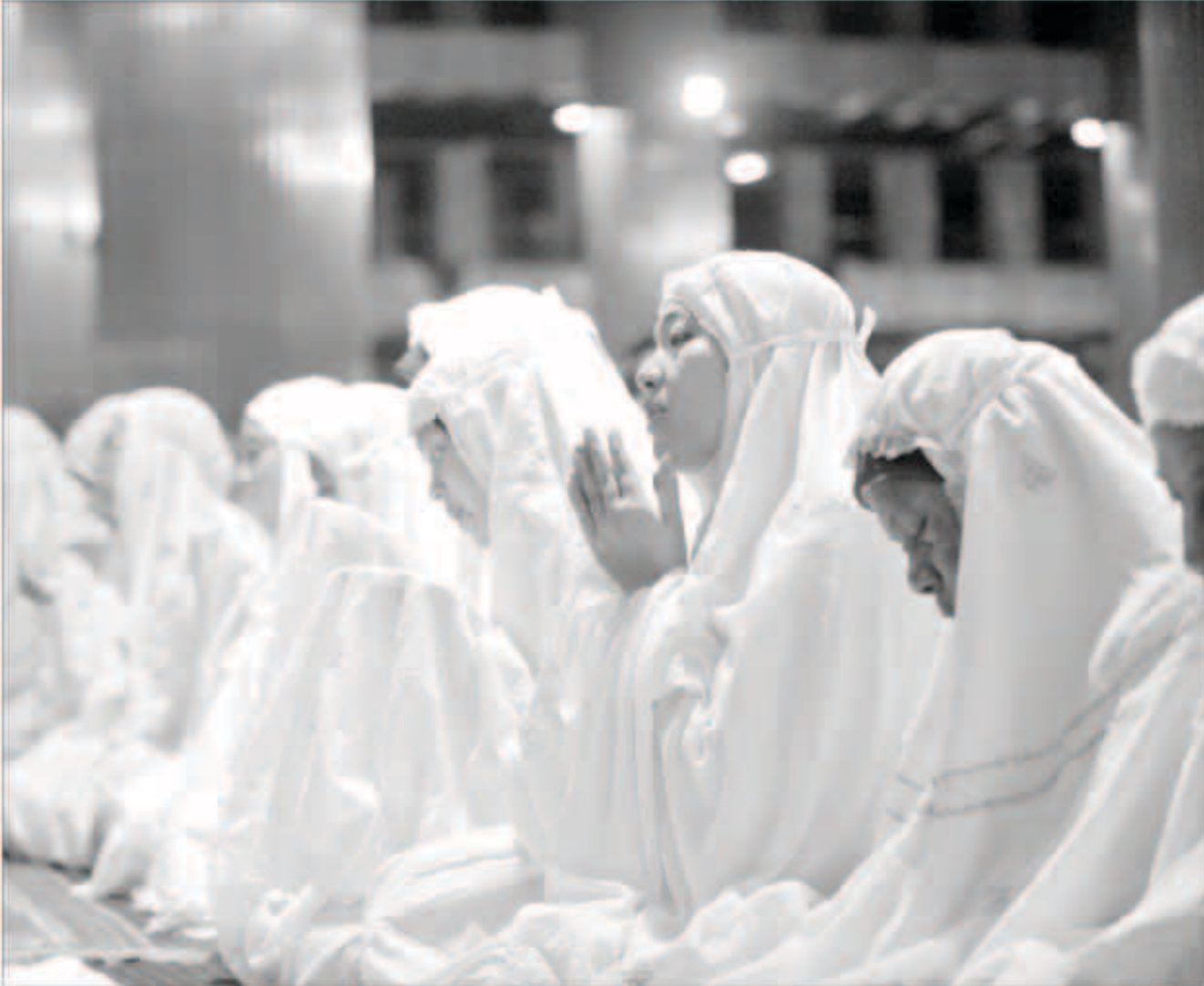
المرأة المسلمة مدعوة في الشهر الفضيل إلى تحميص نفسها وبيتها بالقرب إلى الله